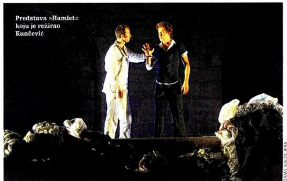
Predstava »Hamlet« koju je režirao Kunčević

Nagrade i priznanja Objavio je zbirke teatroloških eseja »Ambijentalnost naš dubrovačku« i »Redateljske bilješke«. Za svoj rad Kunčević je