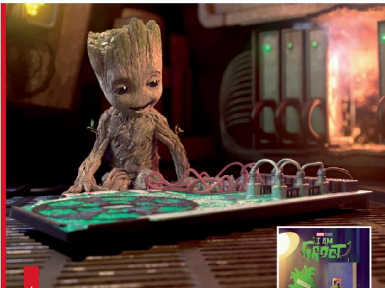
Maja Šitum / Story Press; Profimedia