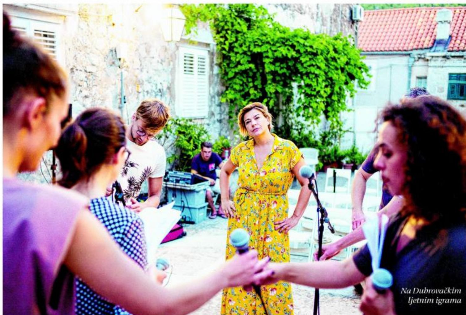
Na Dubrovačkim ljetnim igrama